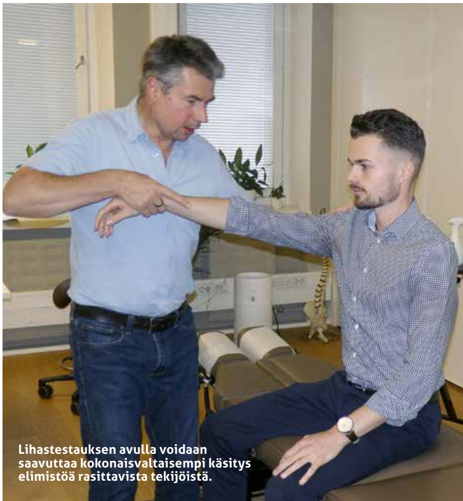
Lihastestauksen avulla voidaan saavuttaa kokonaisvaltaisempi käsitys elimistöstä rasittavista tekijöistä.

Ensimmäisellä käynnillä Chydenius Kiropraktikkokeskuksessa käydään läpi asiakkaan terveyshistoriaa ja tehdään kokonaisvaltainen tutkimus. Toiminnallisen neurologian tutkimukseen sisältyy kattava tasapainolinjärjestelmän ja keskushermoston analyysi, johon sisältyy