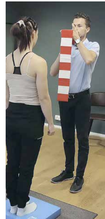
Toiminnallista neurologiaa käytännössä.

– Tällä viikollakin oli potilas, joka itki ilosta saatuaan apua vuosia jatkuneeseen ongelmaan. Tällaiset kohtaamiset ovat suurin syy, miksi teemme tätä, hän kiteyttää. LU